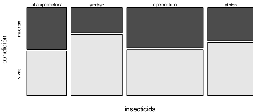
Figura 2. Gráfico de mosaico (Mosaic Plot) para Acaricida y condición de la larva.

Finally, we can conclude that the methodology used is modern for the case under study, finding some similar applications in the ticks' control in dogs (Morales and Nava, 2006).